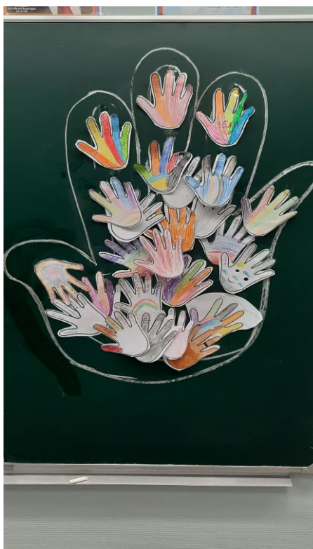
Рефлексия учебной деятельности на уроке («Ладони учеников в ладошке учителя»).