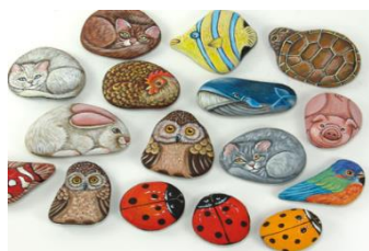
Рисунки на камнях камень выкрашен в виде кошки и т. д.