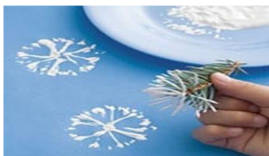
Рисунок штампами снежинки еловой веткой

Отпечатки можно делать и природными материалами, например, еловой веткой или большим листом от растения.