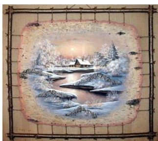
Рисунок на бересте