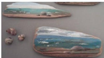
Рисунки на спилах