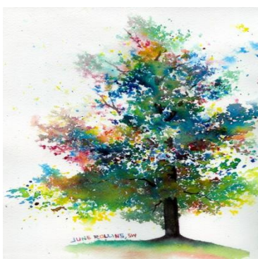
«Дерево» (техника: брызги)

При помощи брызг можно написать целую картину: