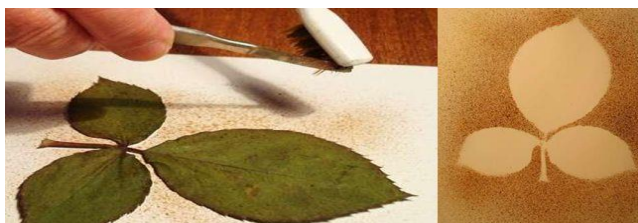
«Лист»( техника – брызги)

Материалы: альбом, краски, кисточка, зубная щетка, и изображение предмета или трафарет.