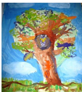
«Дерево» с оттиском ниток

Материалы: нить шерстяная, основа, краска, кисть, бумага, баночка для воды.