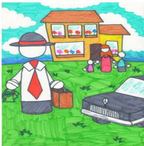
Школьники 6-7 классов